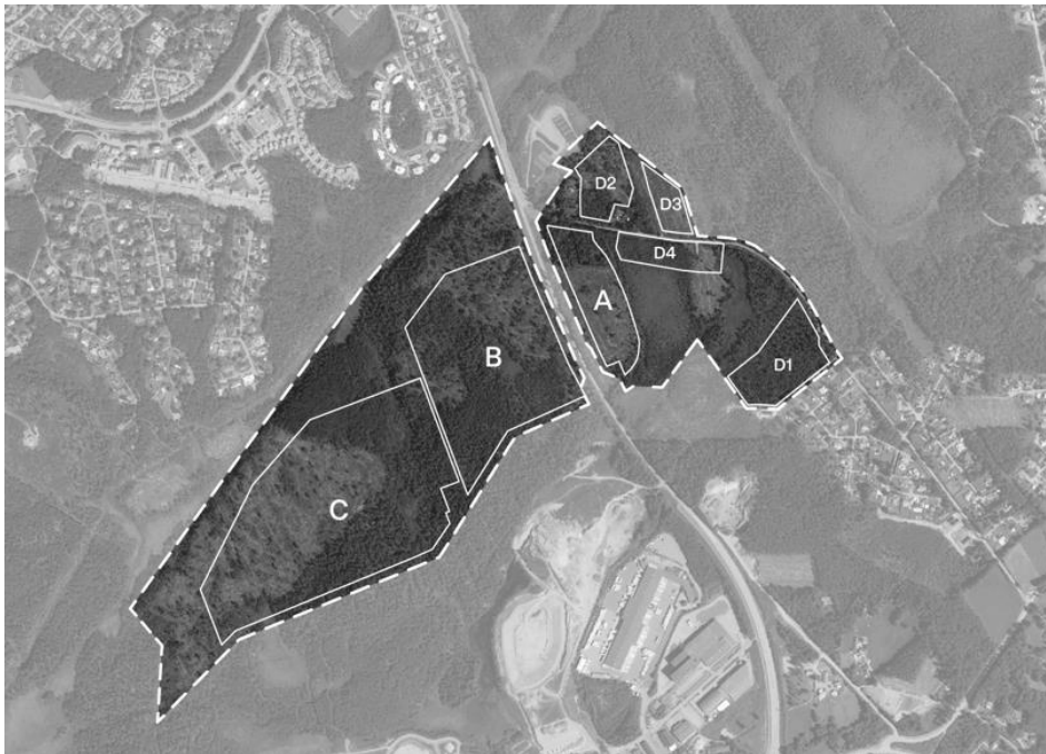
Figur 2. Föreslagen byggnation inom planområdet där delområdena A – B - C utgörs av logistik-/verksamhetsområden och D1 – D4 av bostadsområden.

I Figur 2 visas områdena för föreslagen byggnation inom planområdet. Delområde A – B - C utgörs då av logistik-/verksamhetsområden och delområdena D1 – D4 av bostadsområden.