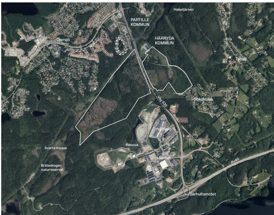
Figur 1. Karta som visar läge för detaljplaneområdet inringat med vit linje.

Planområdet har en area på ca 82 ha. Ingående fastigheter Bråta 2:153 (tidigare del av fastigheten Gökskulla 3:33, del av Bråta 2:106 samt hela Gökskulla 6:1 och Gökskulla 7:1) är privatägda medan Bårhult 1:112 ägs av Härryda kommun. Inom planområdet ligger även 5 stycken privatägda fastigheter (Gökskulla 8:1, 9:1, 37:1, 2:3 och 44:1) samt en samfällighet (Gökskulla s:5). Detaljplaneområdets läge och omfattning framgår av Figur 1.